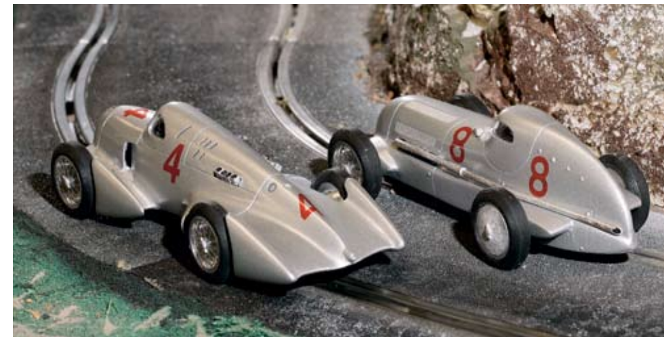
Os slots em resina da TRRC captam na perfeição as formas dos recordistas de AVUS. O chassis é Penelope Pitlane, em latão