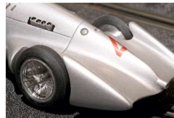
Na traseira aerodinâmica do Auto Union não falta sequer a saída de escape. As jantes de raios são de uma perfeição total. Todos os modelos prontos a correr da TRRC são limitados a 150 unidades