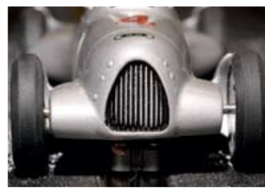
As grelhas dos carros que competiram em AVUS-Rennen estão perfeitamente replicadas