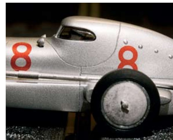
A carlinga do Mercedes-Benz W25 está perfeitamente definida. As jantes traseiras têm tampões que melhoram o fluxo de ar